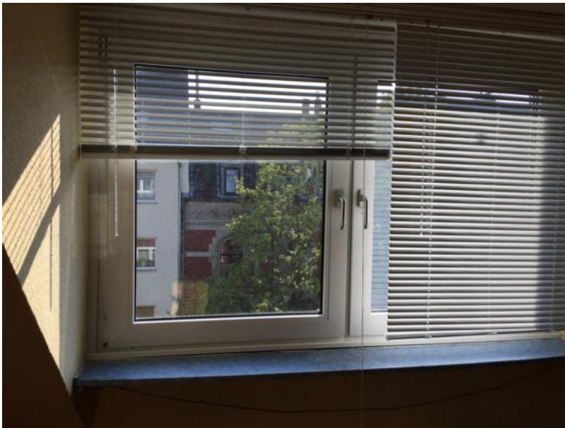
Block aus dem Fenster zur Kölner Straße