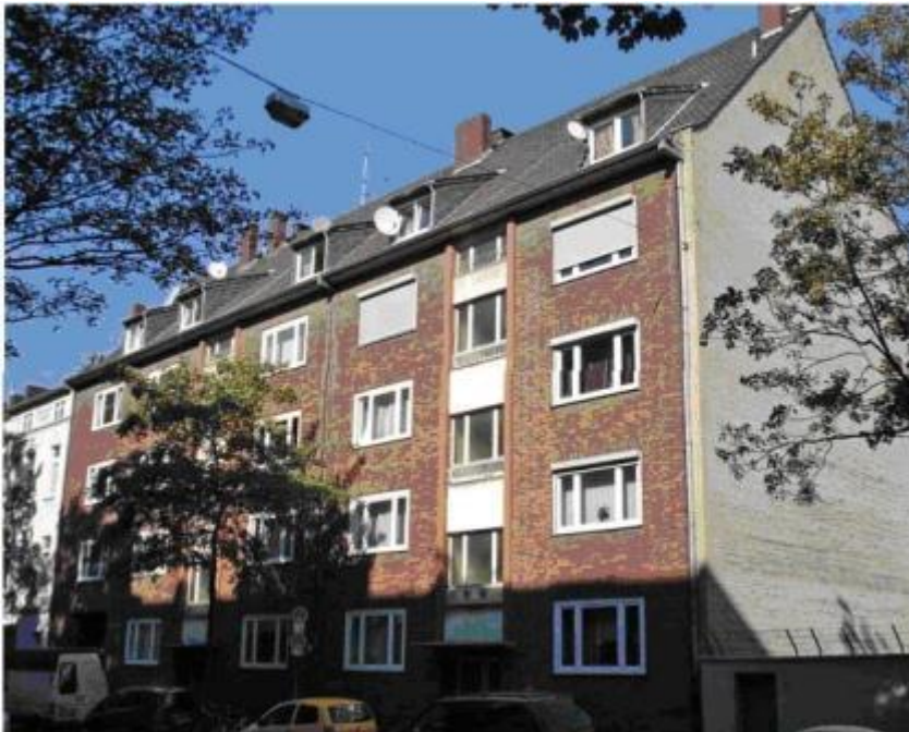
Haus Kölner Str. 338 Düsseldorf-Oberbilk - Vorderansicht

Geschäfte für den täglichen Bedarf gibt es in unmittelbarer Nähe. Es gibt eine gute Anbindung mit den öffentlichen Verkehrsmitteln zu den anderen Stadtteilen Düsseldorfs und eine gute Anbindung zur Autobahn 46.