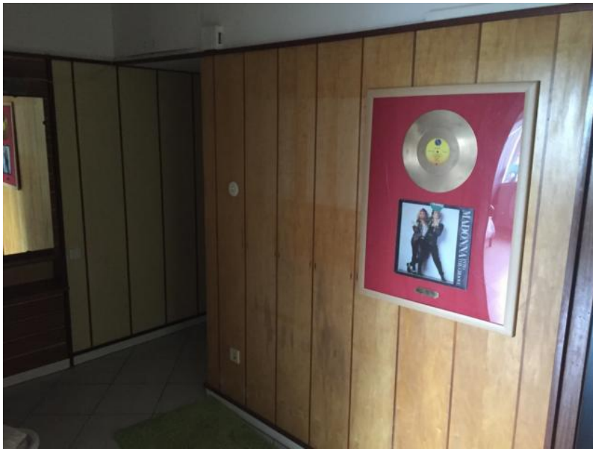
Hier ein Bild vom Flur