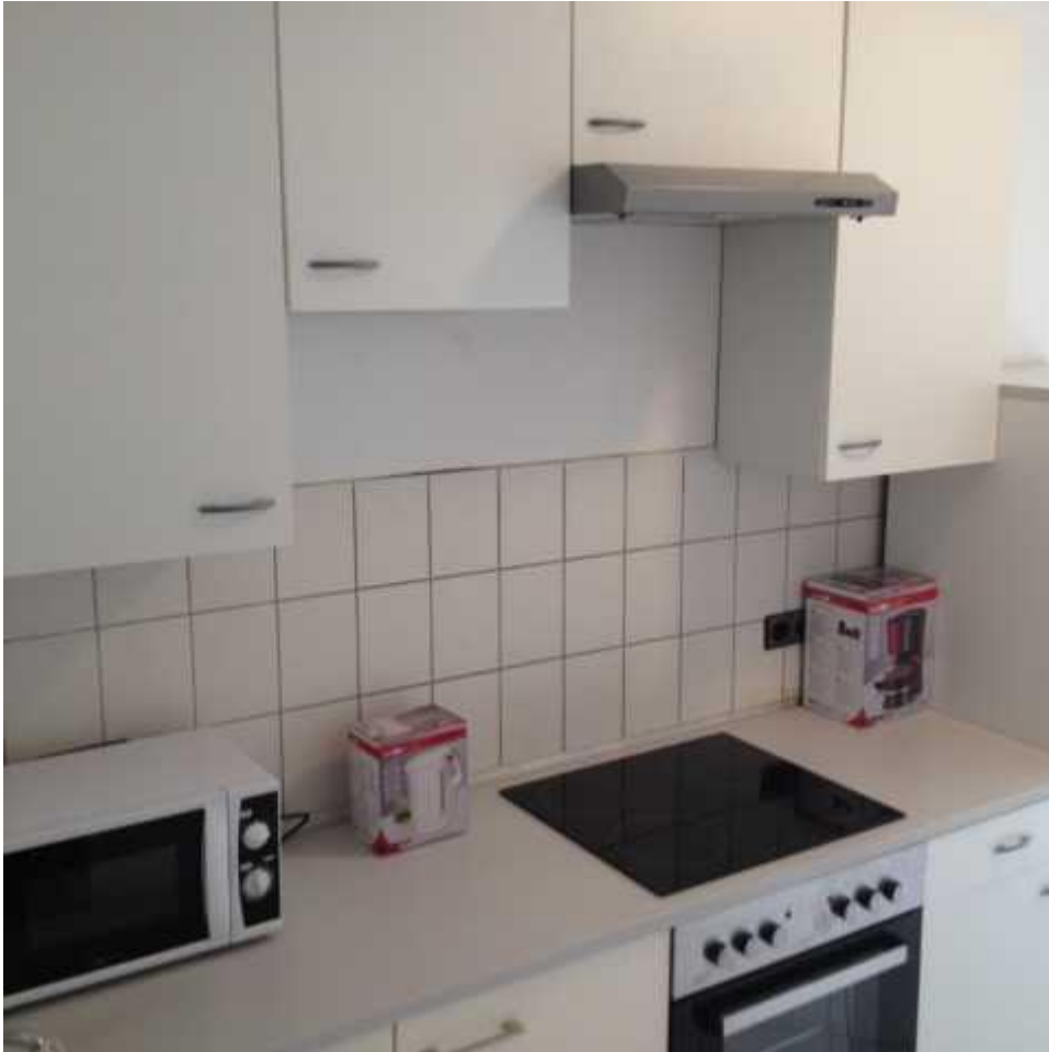
Küche der Wohnung 3. Stock links Flur